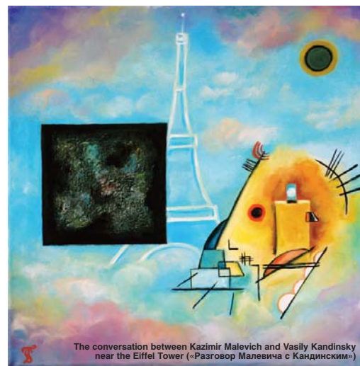
The conversation between Kazimir Malevich and Vasily Kandinsky near the Eiffel Tower («Разговор Малевича с Кандинским»)

В-третьих, всем понимать и не надо. Достаточно избранных. Все не создают то, чем пользуются все. Создают всегда избранные, особенные. И эти избранные черпают свои идеи там, где другие не видят ничего, просто потому, что