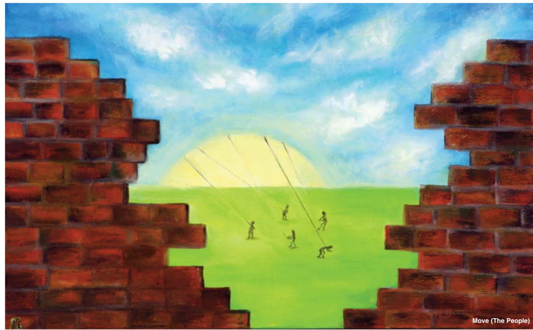
Move (The People)

Мой цикл истинной фигуративной абстракции — это абстрактная живопись, в которой можно угадать или увидеть фрагменты, скажем, пейзажа, которые как бы проступают сквозь туман абстрактной живописи.