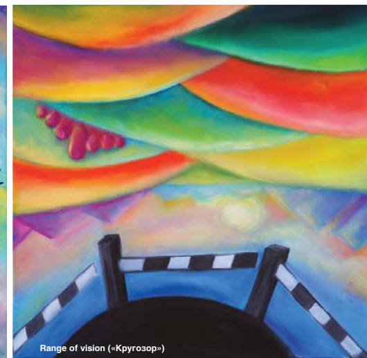
Range of vision («Кругозор»)

не видят ничего привычного и знакомого. Искусство должно быть непривычным. Может, даже немного неудобным. Тогда у нескольких избранных оно рождает идеи, которые превратятся в то, что изменит мир к лучшему, сделает его удобнее. Может быть, кто-то, посмотрев мои картины, придумает телепортацию или межзвёздный космический корабль. Ведь для того, чтобы это придумать, нужно выйти за границы своего «серого квадрата», своих «шлагбаумов».